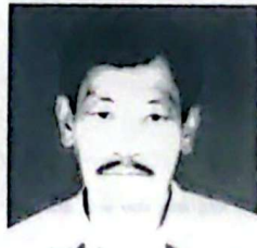
কে বীৰেন্দ্ৰ সিংহ ট্ৰাষ্টি