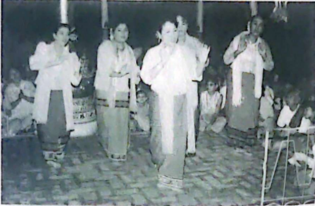
লাইমাংদা মৈতৈ লৈশাবীশিংগী জগোয় খুংথেক অমা

বার্মাদা খুন্দাদুনা লৈখিবা ইচিন-ইনাওশিংগী খোঙ্গুল লিরুন্দা থেংনরকপা মনিপুরি মুসলিম শিংগী পুলিগী বারী তারুরগা মীংলু পীরাং ঈহৌখিবা খঙহৌদে ইমা মনিপুরদগী লাপথোক্কীংদে হায়বা বাহৈসিনা মখোয়গী মরৈবাক নুংশিবগী ঈহল হৌজিক ফাওবা মাগী থম্মোয়দা লৈরি হায়বসি তাকই। মালেমগী মফম কয়াদা মচোই মচোই তাপ্রবা মৈতৈ হায়বা ফুরুপ অসিনা লৈনরিবা লমদমশিংদা