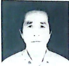
এইচ ফাখ্ৰুনী সিংহ ট্ৰাষ্টি