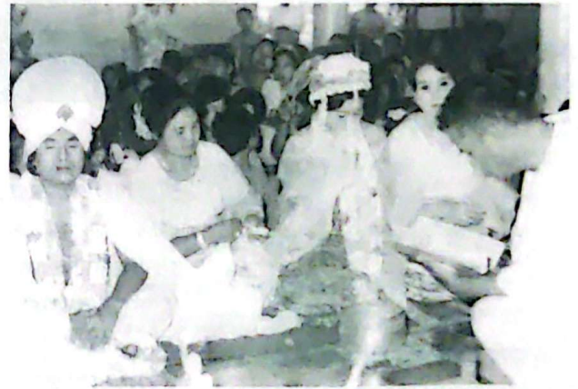
বামোনইমুং অমগী লুহোংবগী থৌরম অমা

আমরাপুরা হায়রিবা খুঙ্গং অসিদা মৈতৈশিংনা অবা (হৌজিক্লা Myanmar হায়না) দা লাকপদা শগোন্নরকখিবা ইপুধৌ পাখংবগী মুক্তি অমদি ইমা লৈমরেন শিদবীগী মুক্তি লৈরি অমদি লাইশং শাদুনা ইরাং থৌনিরিরি। মথংগী খুল শ্রীগ্রাম হায়বা খুল অমদা অমুক