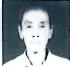
এল গৌৰ মোহন সিংহ ট্ৰাষ্টি