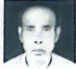
বাই হৰিদাস সিংহ ট্ৰাষ্টি