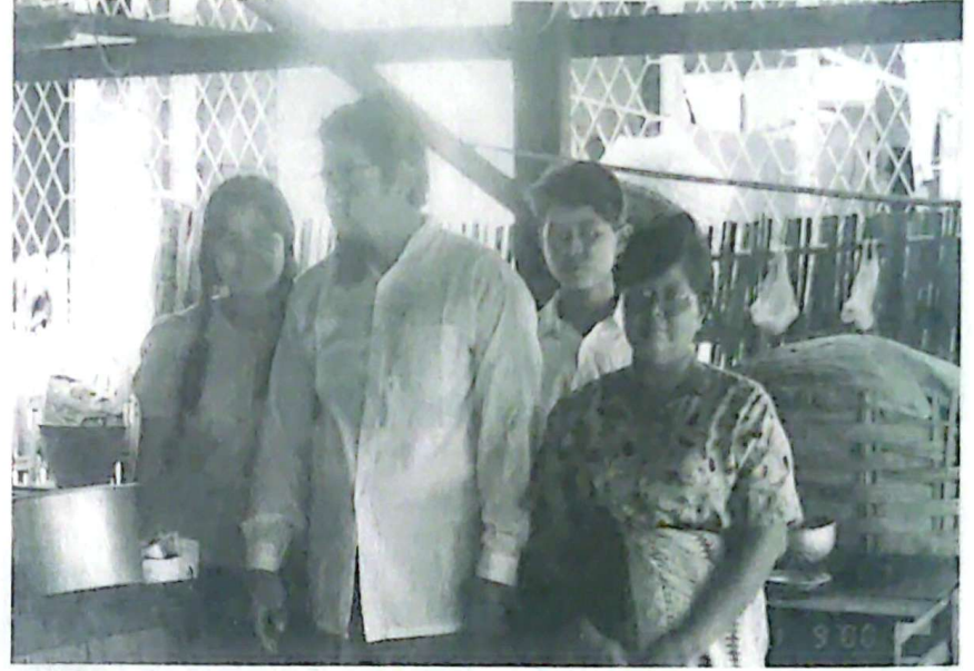
বার্মাদা খুন্দাদুনা লৈরিবা মৈতে পাঙল ইমুং অমা

মনিপুরীশিংগী থম্মোয়দা মরৈবাক নুংশিবগী ইহলদি অদুমক লৈরি অদুবু তাশিন খোমজিন্দুনা অমৎতা ওইবা চাওখং খোংথাংদা চঙশিনমিনুবগী পান্দমদি থোইদোক্কা উবা ফংদ্রি। হৌজিক হিরম খুদিংমজ্ঞা চাওখংলুক্কা মতম অসিদদি লনাই মীওই অমা থক্কা তৌবা গুম্বা থবক্তগীদি অপুনবা লিচিংগী ওইবা থবক্কা হেন্না খুমাঙ চাওশিল্লি হায়বা বাখল্লোন্দা যুমফম ওইদুনা শেমগং শাগৎনরক্কা মতম্বী। লল্লোন ঈতিক অমদি শেদ্দান লম্বীদা, রাজনীতি অমদি