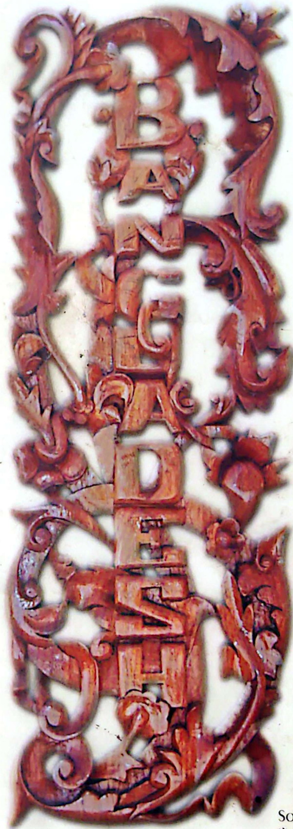
WOOD CRAFT SOIBAM SHYAMKISHOR MEITEI NAYAPATAN, ADAMPUR BAZAR KAMALGONJ, MOULVIBAZAR BANGLADESH